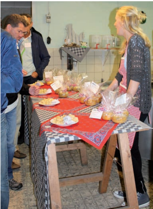
Bij de kaasboerderij van de familie Spil kon geproefd worden van bijzondere kaasjes