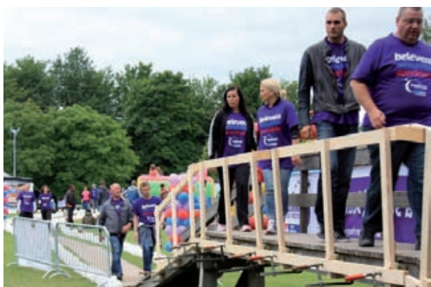
Samenloop voor Hoop in het Streekbos; een hoopgevend en indrukwekkend evenement

In 2015 hebben 45 evenementen en activiteiten plaatsgevonden.