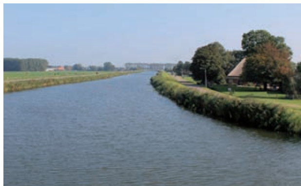
De Ursemmervaart maakt al deel uit van de BRTN

Tot slot is het Recreatieschap in 2015 gestart met de voorbereidingen voor het vernieuwen van de bewegwijzering van het vaarrouthenetwerk. De nieuwe bewegwijzering sluit aan bij de landelijk norm voor sloepennetwerken. Dit biedt ook de mogelijkheid om het netwerk op te nemen op de website en app van het sloepennetwerk. Het streven is om de bewegwijzering voor het vaarseizoen 2016 gereed te hebben.