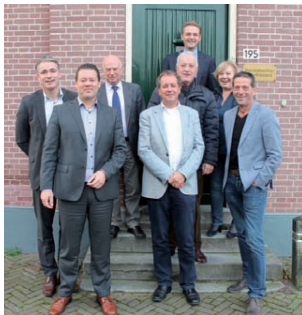
Het algemeen en dagelijks bestuur van het Recreatieschap in december 2015.