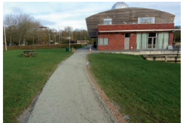
Een tijdelijk vies pad, maar mooi opgeknapt

De collega's van Groen- en Recreatiebeheer hebben in de wintermaanden tijd voor groot onderhoud. Op een aantal doorgaande paden op de terreinen Vooroever Vlietsingel en het Streekbos heeft het Recreatieschap in november kleischelpen laten aanbrengen. De ophoging was noodzakelijk omdat op een aantal plekken water bleef staan bij langdurige regenval. In het begin zijn de paden wat smerig, maar als het pad goed in gebruik is wordt de bovenlaag keihard en vlak en gaat deze weer vijf tot zes jaar mee.