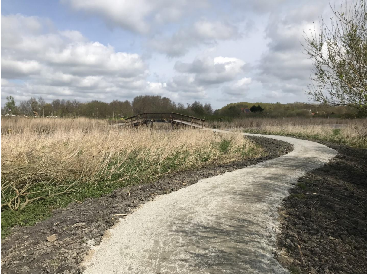
Een nieuw aangelegd wandelpad met brug in De Hulk

In 2023 is het project Kwaliteitsimpuls De Hulk afgerond. Om de recreatiemogelijkheden en de natuurwaarden van het gebied te verhogen zijn verschillende functies toegevoegd en de routestructuren verbeterd. Hierbij is ook de aansluiting gemaakt op aangrenzende gebieden en een koppeling gemaakt met projecten zoals de dijkverzwaring tussen Hoorn en Amsterdam. Als onderdeel van deze werkzaamheden wordt het doorgaande fiets-/wandelpad gerealiseerd. Vanuit De Hulk is een verbinding gelegd met dit pad en het buitendijkse deel van De Hulk dat in de toekomst wordt opgevaardeerd.