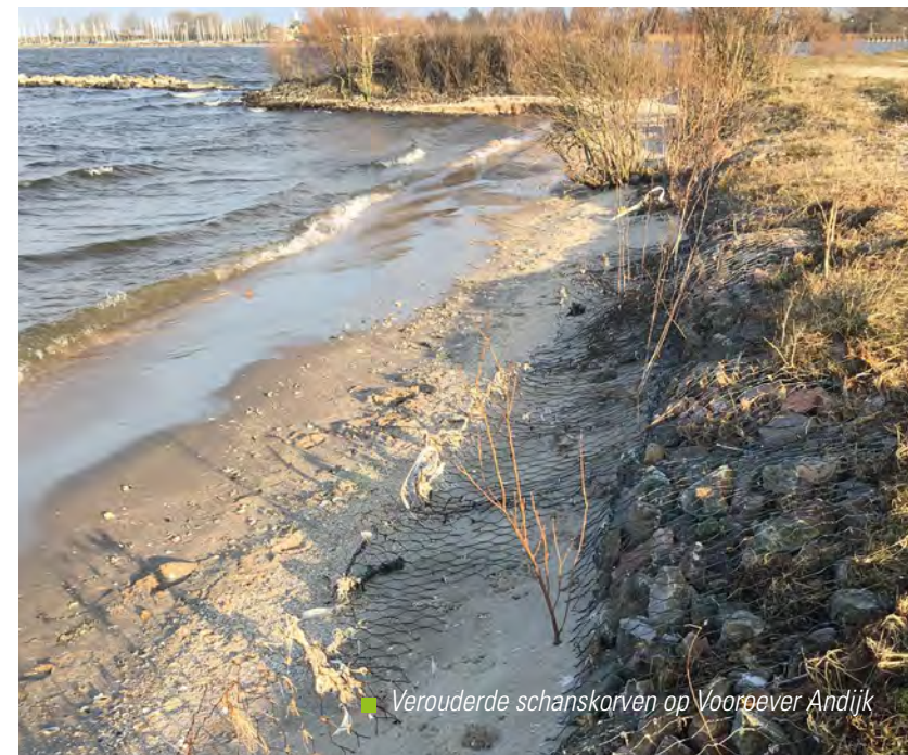
■ Verouderde schanskarven op Vooroever Andijk

De werkzaamheden starten in januari 2026.