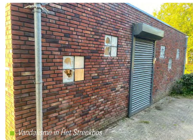
■ Vandalisme in Het Streekbos

De kostenpost ten opzichte van 2024 is gestegen en bedraagt in 2025 ruim 20.000 euro (kosten derden en eigen inzet). ■