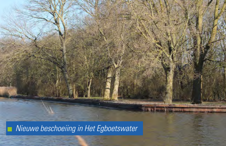
■ Nieuwe beschoeiing in Het Egboetswater