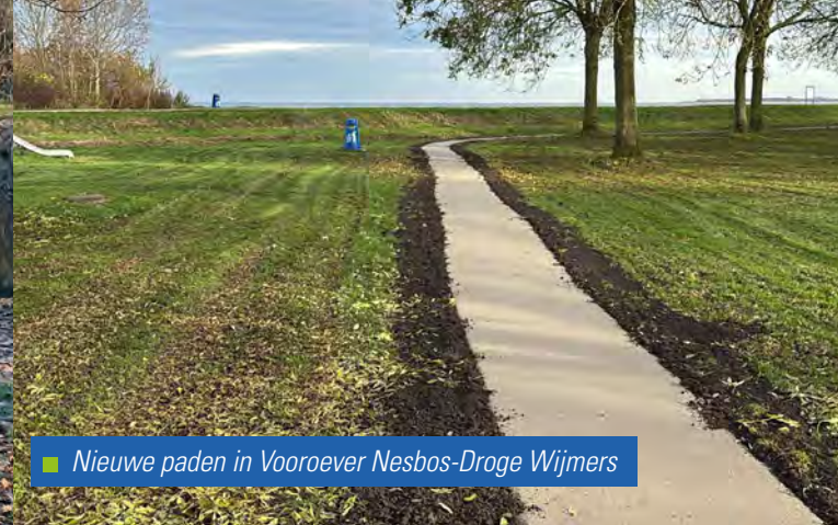
■ Nieuwe paden in Vooroever Nesbos-Droge Wijmers