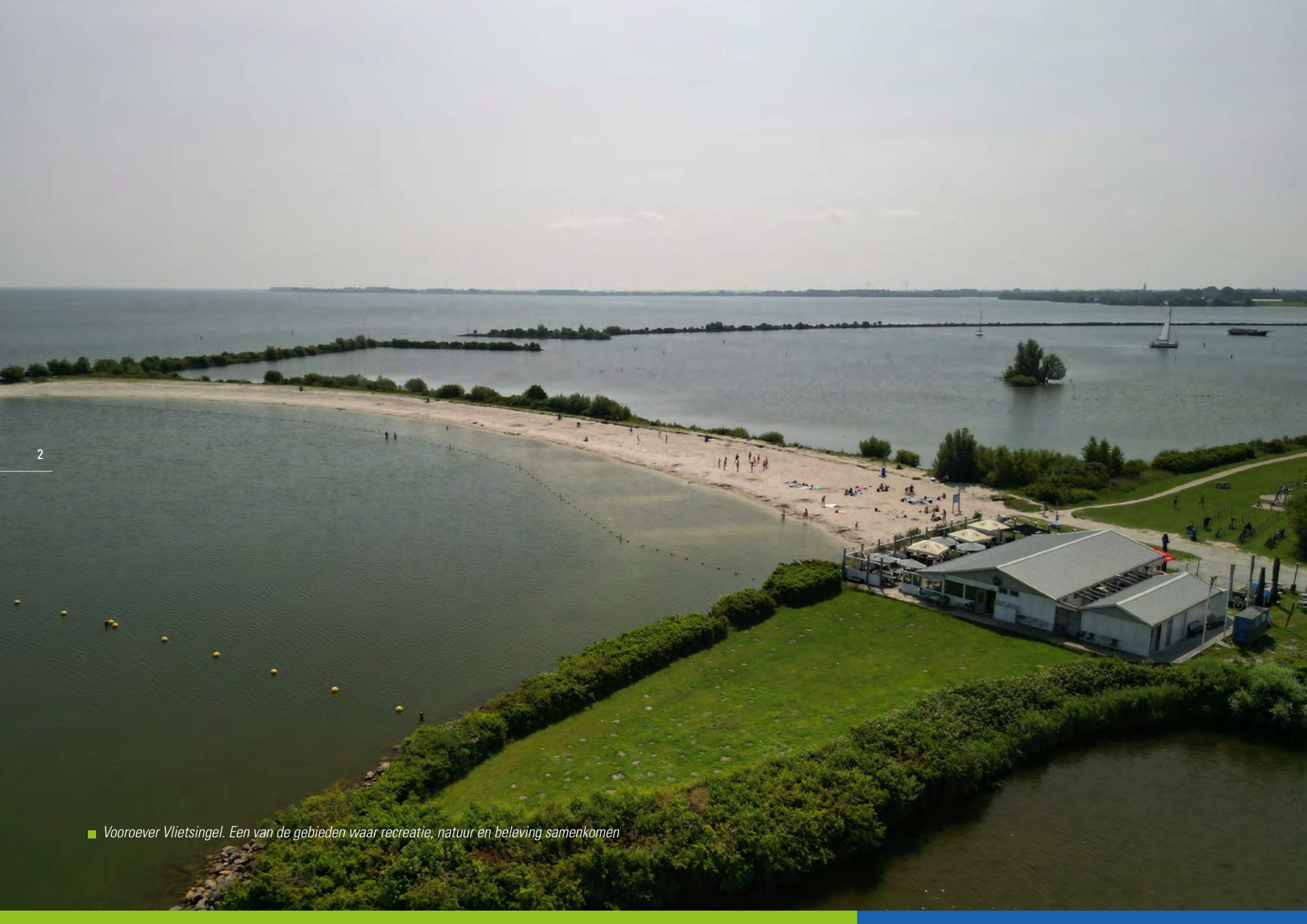
■ Vooroever Vlietsingel. Een van de gebieden waar recreatie, natuur en beleving samenkomen