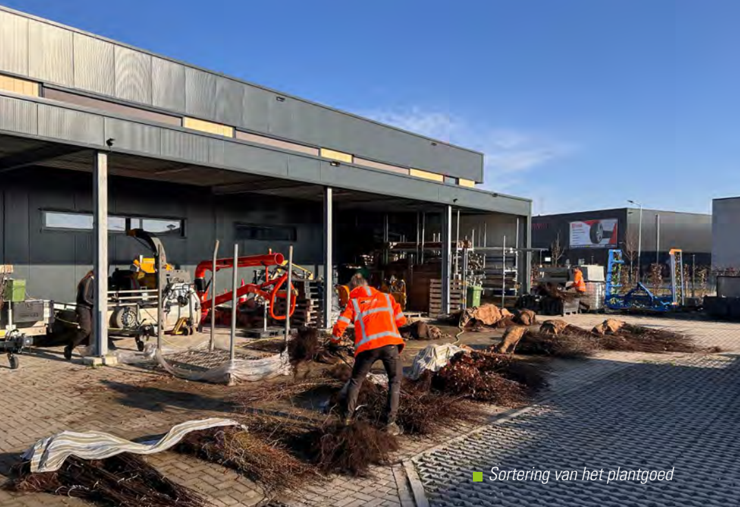
■ Sortering van het plantgoed