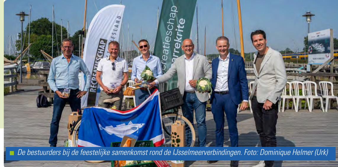
■ De bestuurders bij de feestelijke samenkomst rond de IJsselmeerverbindingen.