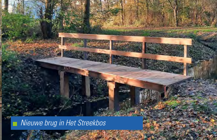
■ Nieuwe brug in Het Streekbos