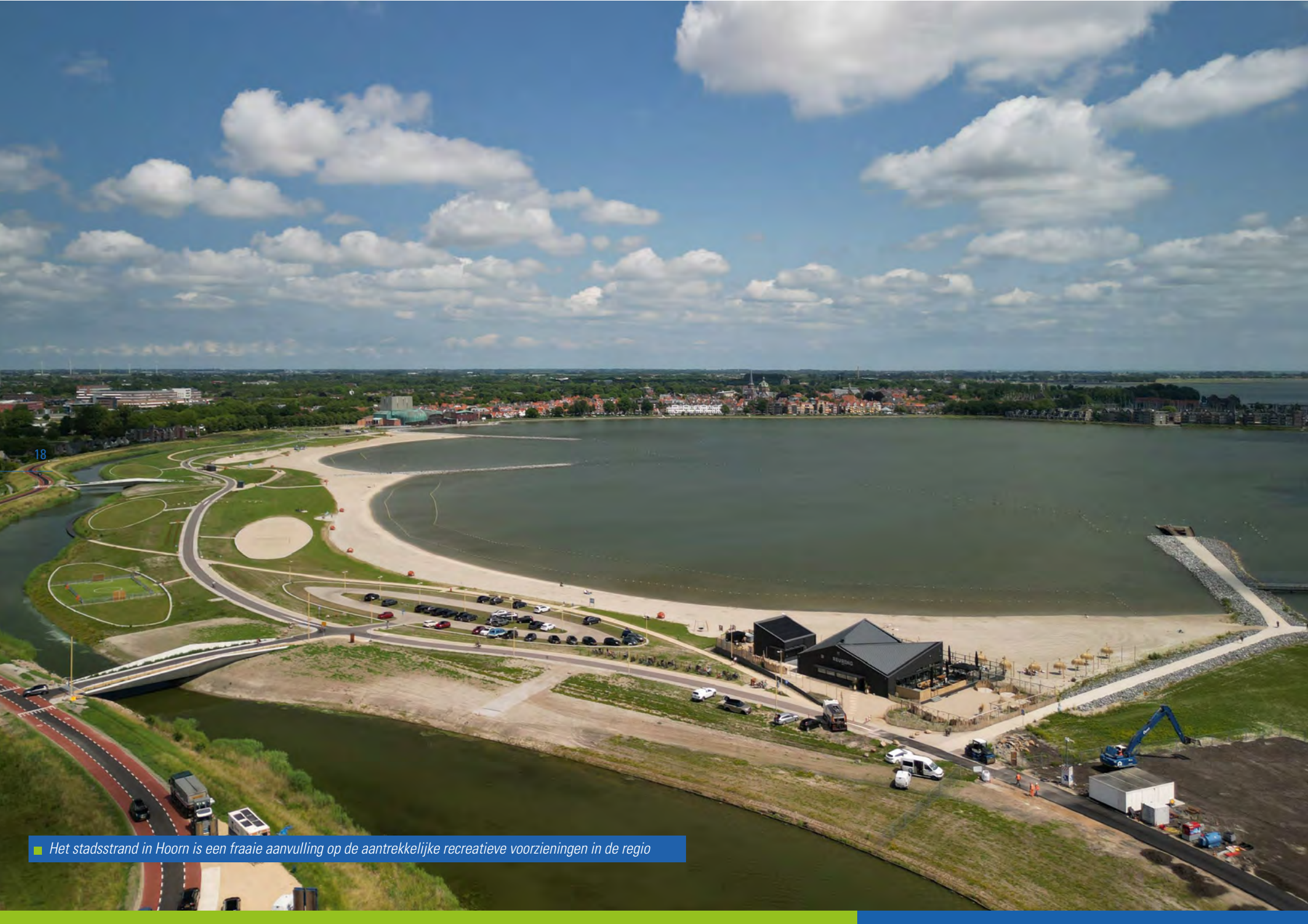
■ Het stadsstrand in Hoorn is een fraaie aanvulling op de aantrekkelijke recreatieve voorzieningen in de regio