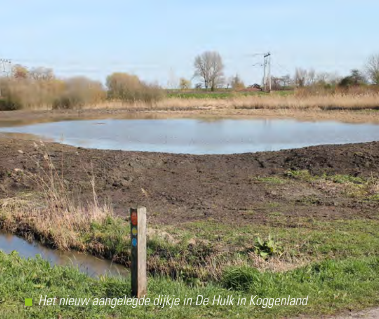
■ Het nieuw aangelegde dijkje in De Hulk in Koggenland