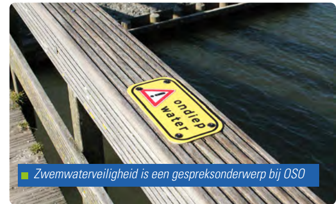
■ Zwemwaterveiligheid is een gespreksonderwerp bij OSO

Het Recreatieschap neemt daarnaast deel aan de overleggen van het Overlegorgaan Samenwerkingsverbanden Openluchtrecreatie (OSO). Binnen het OSO wisselen leden onderling kennis en ervaringen uit over diverse thema's die breed spelen binnen de recreatiesector. ■