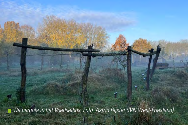
■ De pergola in het Voedselbos.