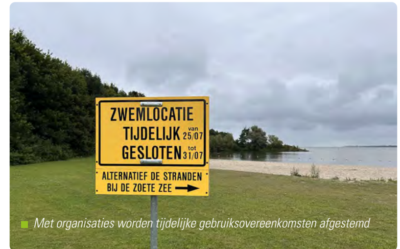
■ Met organisaties worden tijdelijke gebruiksovereenkomsten afgestemd