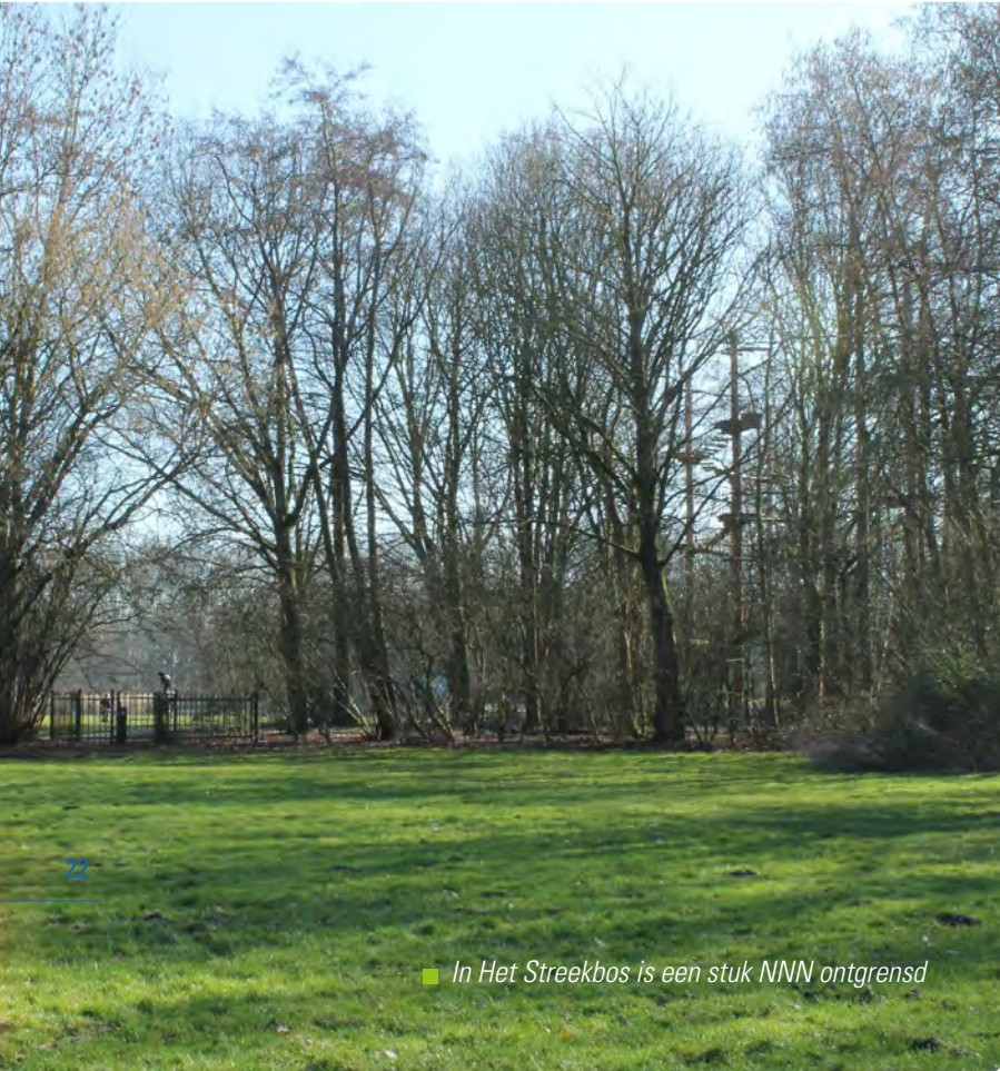
■ In Het Streekbos is een stuk NNN ontgrensd