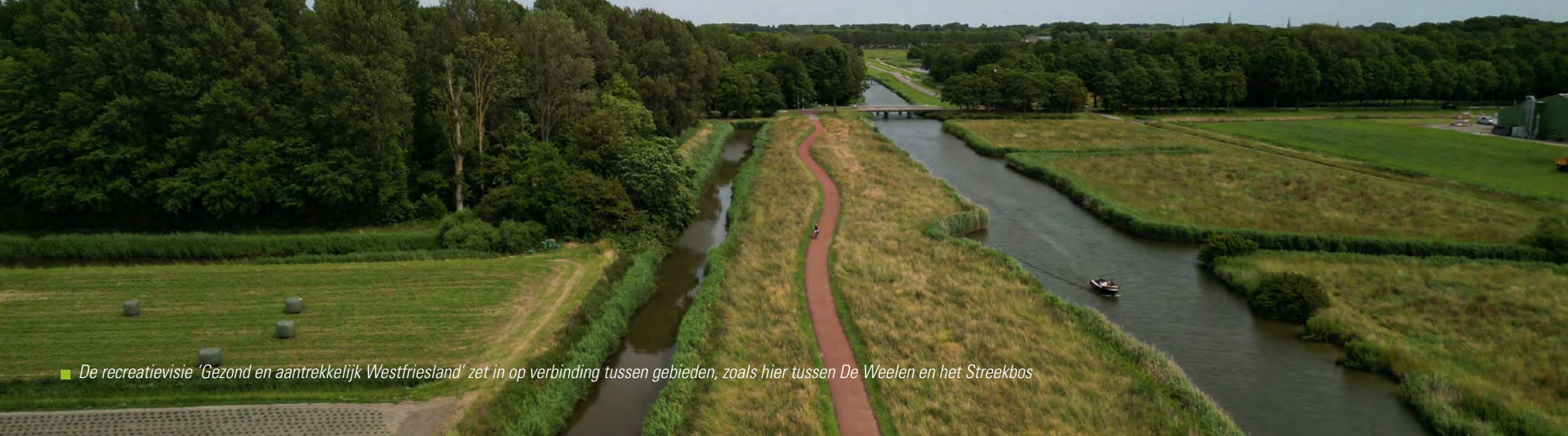
■ De recreatievisie 'Gezond en aantrekkelijk Westfriesland' zet in op verbinding tussen gebieden, zoals hier tussen De Weelen en het Streekbos