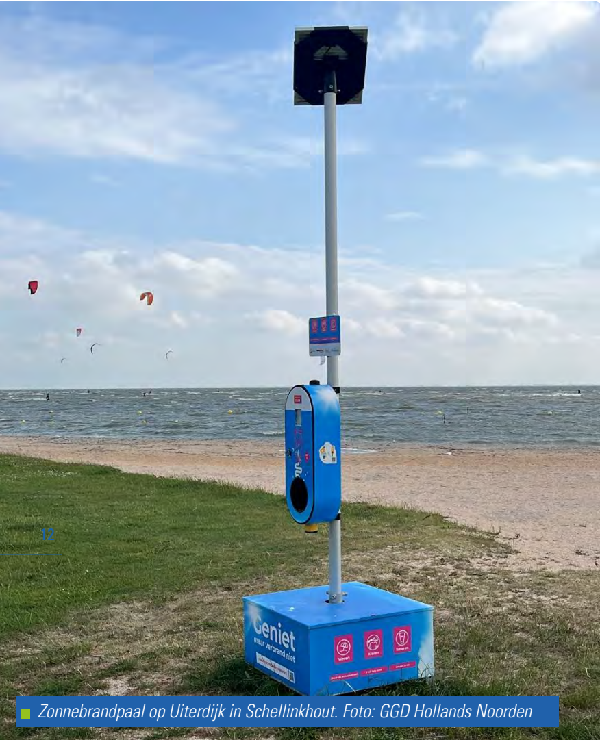
■ Zonnebrandpaal op Uiterdijk in Schellinkhout.